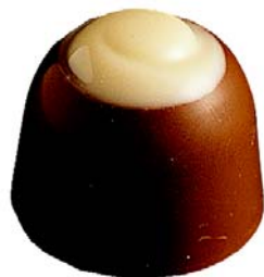
C153 Montana 810 g Sprø hasselnøttkrem