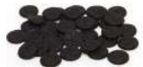
D303 salte lakrismynter