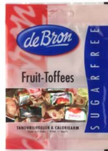
D013 fruktkaramell 90 g EAN 8712514092137