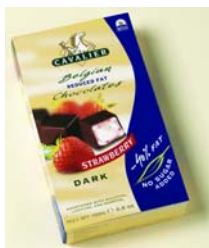
C045 jordbær m/ mørksjokolade lavfett konfektbiter 100 g