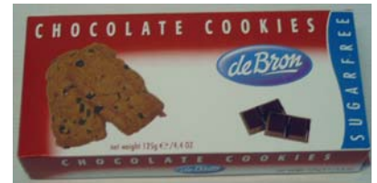
D803 Chocolate Cookies 125g – eske a 9 stk