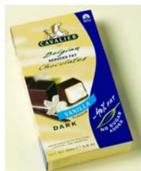
C046 vanilje m/ mørksjokolade lavfett konfektbiter 100 g