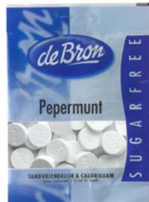
D016 peppermynthe 100 g EAN 8712514098702