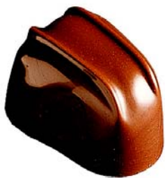
C161 Tropic 1 160 g Kaffekrem