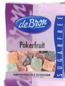
D018 pokerfrukt 90 g EAN 8712514092144