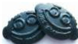
S9013 Funny kids salt lakris