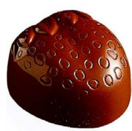
C163 Jordbær 1 020 g Jordbærkrem