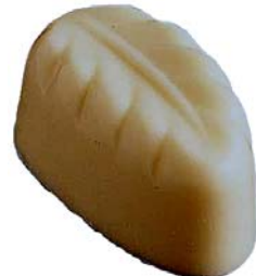
C171 Oakleave 930 g Hasselnøttkrem