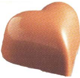
C152 Heart melk 1 040 g Hasselnøttkrem