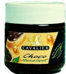
C060 Sjokoladepålegg 200 g - brett a 12 stk