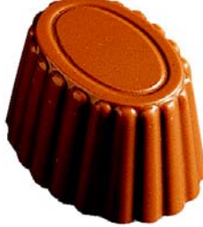
C154 Camée 1 080 g Kokosnøttkrem

Det er også mulig å bestille esker a 1 kg med assortert utvalg av sukkerfri konfekt: