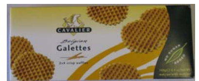
C052 Gallettes 2 x 4 stk 140 g tørre vafler – eske a 12 stk