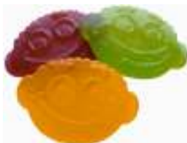
S9012 Funny kids frukt