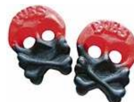
S9014 Bringebær/lakris skalle