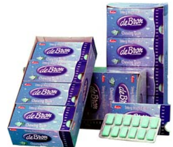
D151 tyggummi 16,8 g/ 12 biter EAN 8712514020000