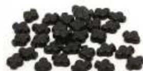
D302 salt lakriskløver