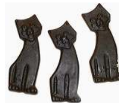
D304 Søte lakriskatter