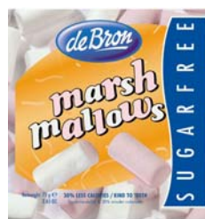
D020 marshmallow 75 g EAN8712514920607