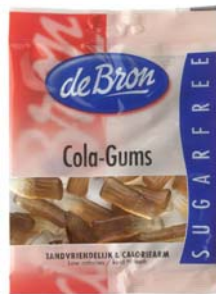
D012 colaflasser 100 g EAN 87125140921120