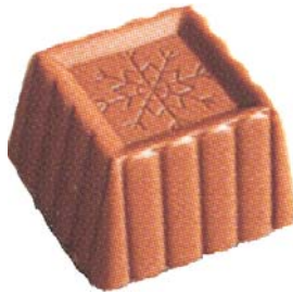
C155 Geometric 910 g Romkrem