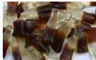
D201 colaflasker 1 kg