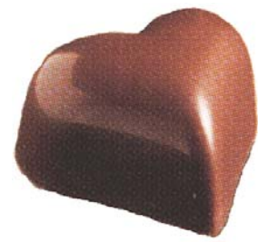
C162 Heart mørk 1 040 g Hasselnøttkrem