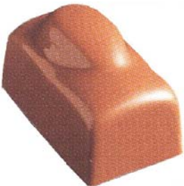
C151 Mandel 1 270 g Hasselnøttkrem og mandel