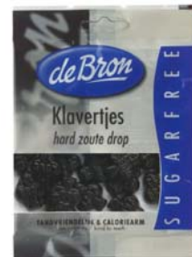
D014 salt lakriskløver 100 g EAN 8712514917157