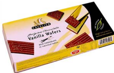
C051 Vanilla Wafers 125 g m/ sjokolade – eske a 12 stk