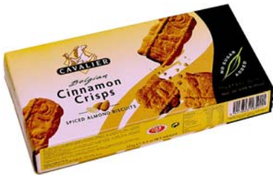
C050 Cinnamon Crisp 125 g, mandelkjets - eske a 12 stk