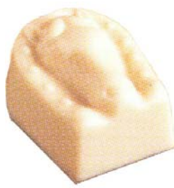
C173 Equus 950 g Pistasjkrem