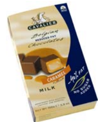
CO48 karamel melkesjokolade Lavfett konfektbiter 100 g