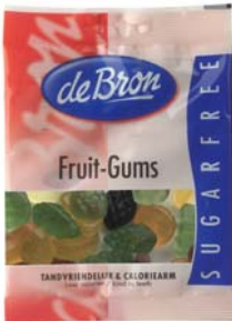
D011 frukt vingummi 100 g EAN8712514092113