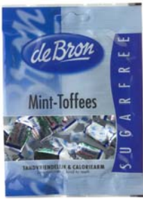
D015 mintkaramell 90 g EAN 8712514092151