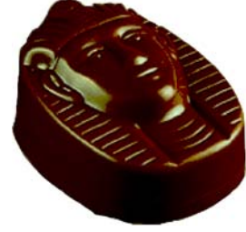
C164 Pharao 1 430 g Hasselnøttkrem