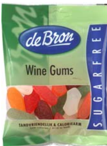
D019 vingummi u/ gelatin 100 g EAN 8712514092199