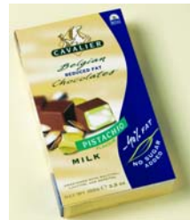
C047 pistasj m/ melkesjokolade lavfett konfektbiter 100 g