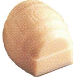
C172 Barrel 1 170 g Cointreaukrem