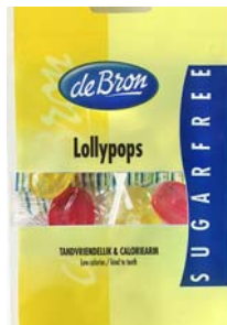
D103 kjærligheter i pose EAN 8712514915405