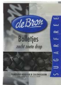
D017 lakrisballer 100 g EAN 8712514093875