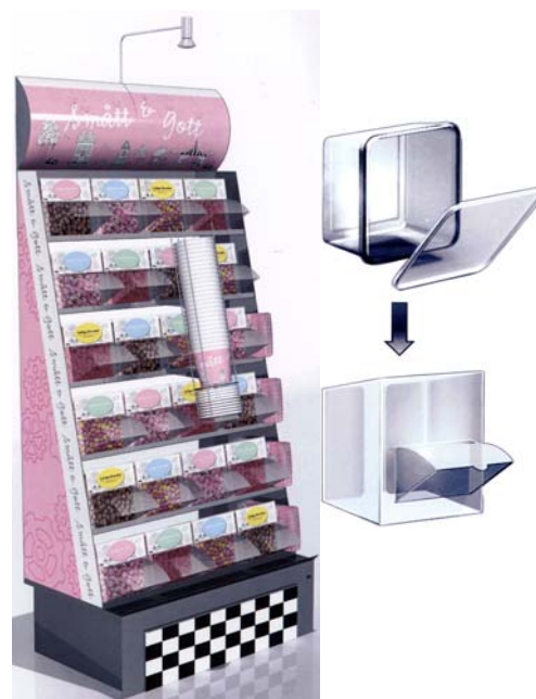
Stativ med 24 kassetter