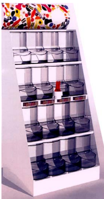
Stativ med 16 støvelbokser