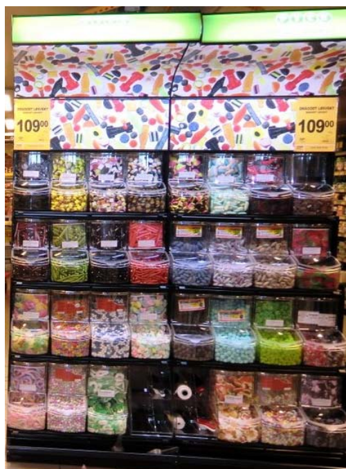
Rett stativ med lystopp