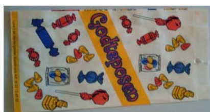
Pose1 liten: 125/35 x 240 mm.